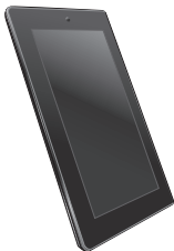
Tablični računalnik ASUS