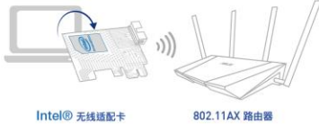
Intel® 无线适配卡产品列表

若您的无线适配卡为上表列出的产品，请依照以下步骤更新您使用的个人计算机/笔记本电脑无线适配卡的驱动程序。